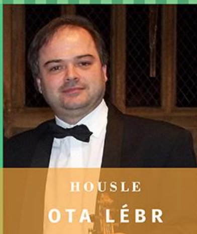
HOUSLE OTA LÉBR